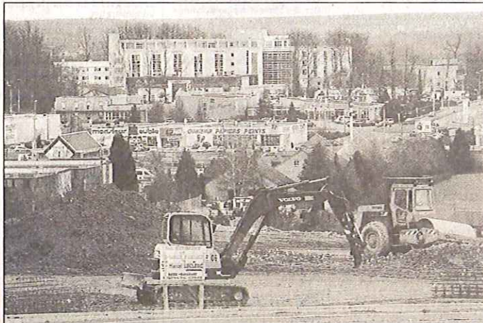
Les travaux de construction du bâtiment qui abritera la jardinerie Botanic, ont commencé en début de semaine.